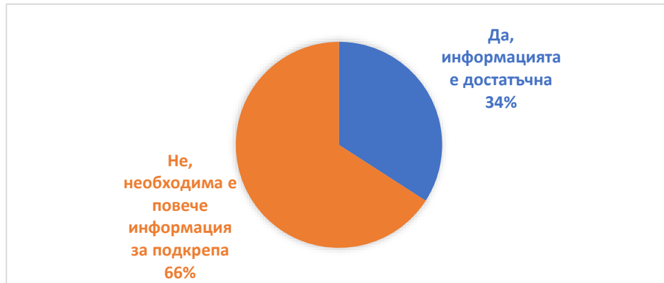
Фиг.1. Относителен дял на отговорите на въпрос №1