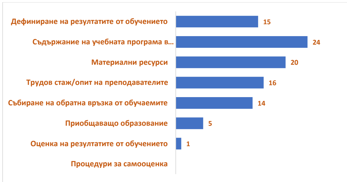
Фиг.3. Разпределение на отговорите на въпрос №3